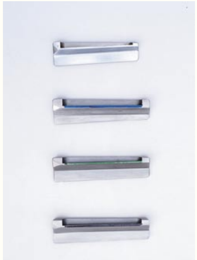
Vier unterschiedliche Zubringer (Ladelöffel) für Mauser-Systeme. Von oben: Standard-System, Basis .375, Basis .416, Basis .500. Für die absolut einwandfreie Funktion des Systems 98 ist eine genau abgestimmte Auslegung von Zubringer und Magazinschacht unbedingt erforderlich. Auch dies ist Bestandteil der hohen Zuverlässigkeit der Mauser-Systeme