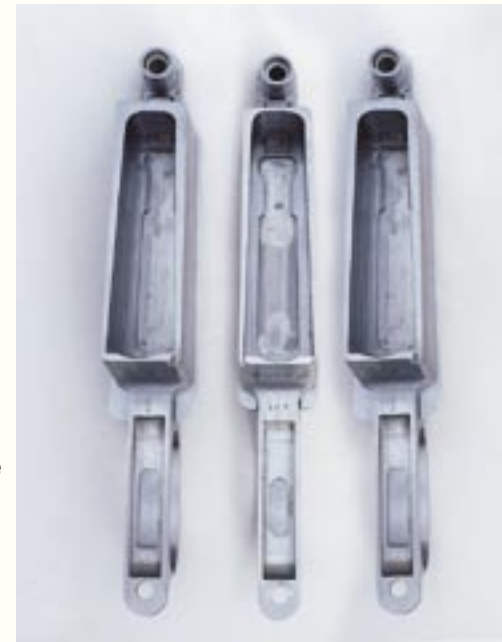
Aus dem Vollen gefertigte Stahl-Magazinkästen für die neuen Johannsen-Großwildbüchsen. Von links: Für Kalibergruppe .375. Dann für die Gruppe .416 und rechts die für die Gruppe .500