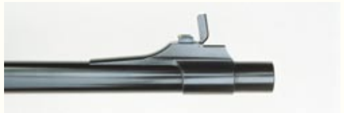
Oben: Kornsatteil als Ring über den Lauf geschoben und angelötet. Unten: Die .505 Gibbs hat auch einen anderen Kornsockel und eine andere Kornausführung als die .500 Jeffery.

wohl mehr eine Referenz an klassische Großwildbüchsen als eine Notwendigkeit für das Schießen in der Dämmerung. Die Schüler-Waffe hat zusätzlich noch einen hochklappbaren Kornschutz.