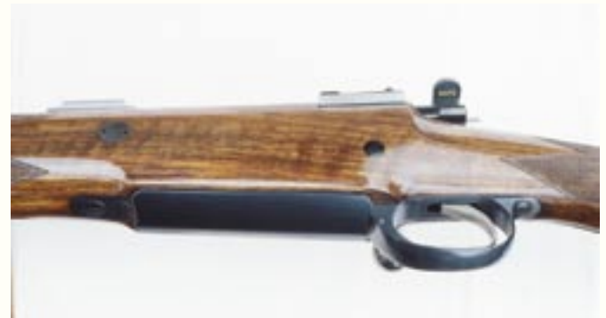
Abzugsbügel mit aufklappbarem Magazindeckel an der .500 Jeffery. In dieser flachen Ausführung fasst das Magazin drei Patronen.