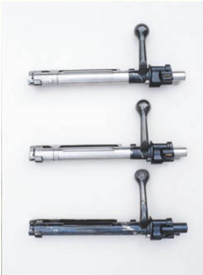
Verschlusskammern für Magnum-Systeme. Unten die Kammer einer originalen Mauser-Magnum-Büchse vor 1937 (Kaliber .280 Halger Magnum). Darüber die beiden neuen Kammern der Johannsen-Büchsen.