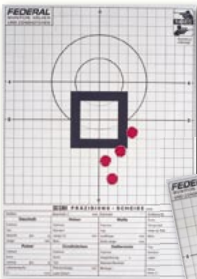
Oben: Trefferbild der .500 Jeffery mit vier Treffern auf 50 m. Streukreis 5,3 cm.