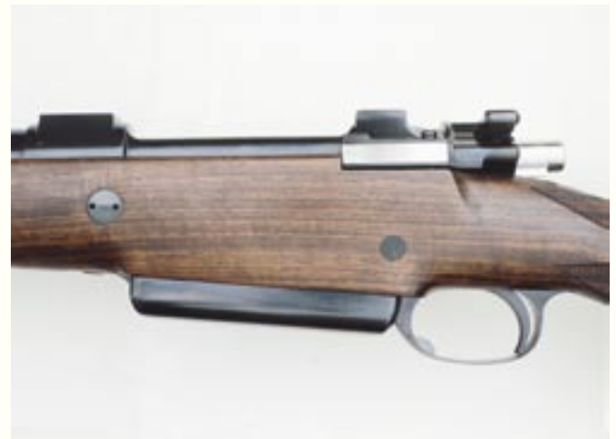
An der Büchse für die .505 Gibbs wurde ein sogenannter Rigby-Deckel installiert. Dadurch wird die Magazinkapazität auf vier Patronen vergrößert. Beide Büchsen haben Flintenabzüge.