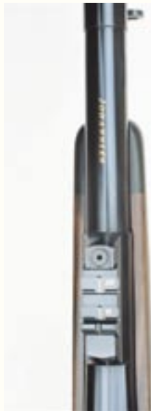
Bei der Büchse für die .505 Gibbs ist das Expressvisier in einem auf den Lauf geschobenen Ring angebracht. Beachte die aufstellbaren Kimmenblätter für 75 und 150 m Schussentfernung.