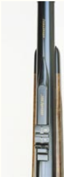
Auf der Büchse im Kaliber .500 Jeffery (12,6x70 Schüler) ist der Visiersockel für das Zweiklappen-Express-Visier aufgelötet. Die Kaliberbezeichnung und die Visierzahlen sind in Gold eingelegt.